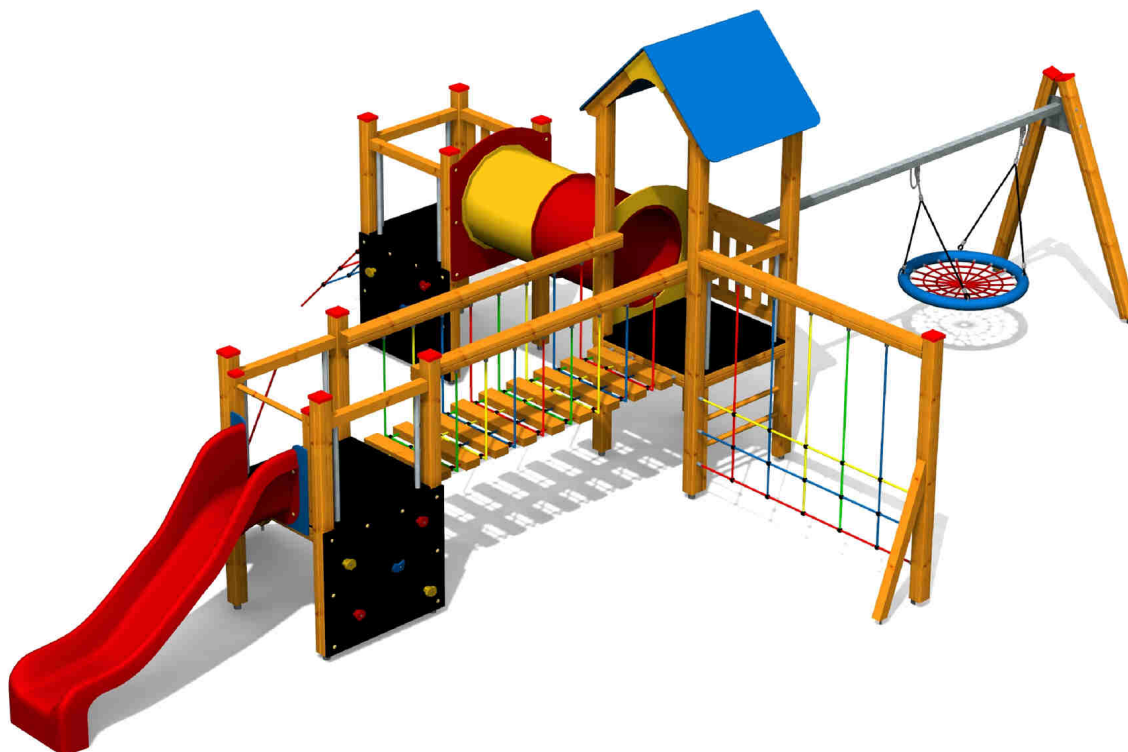
ilustrativní vyobrazení (provedení s lazurou)