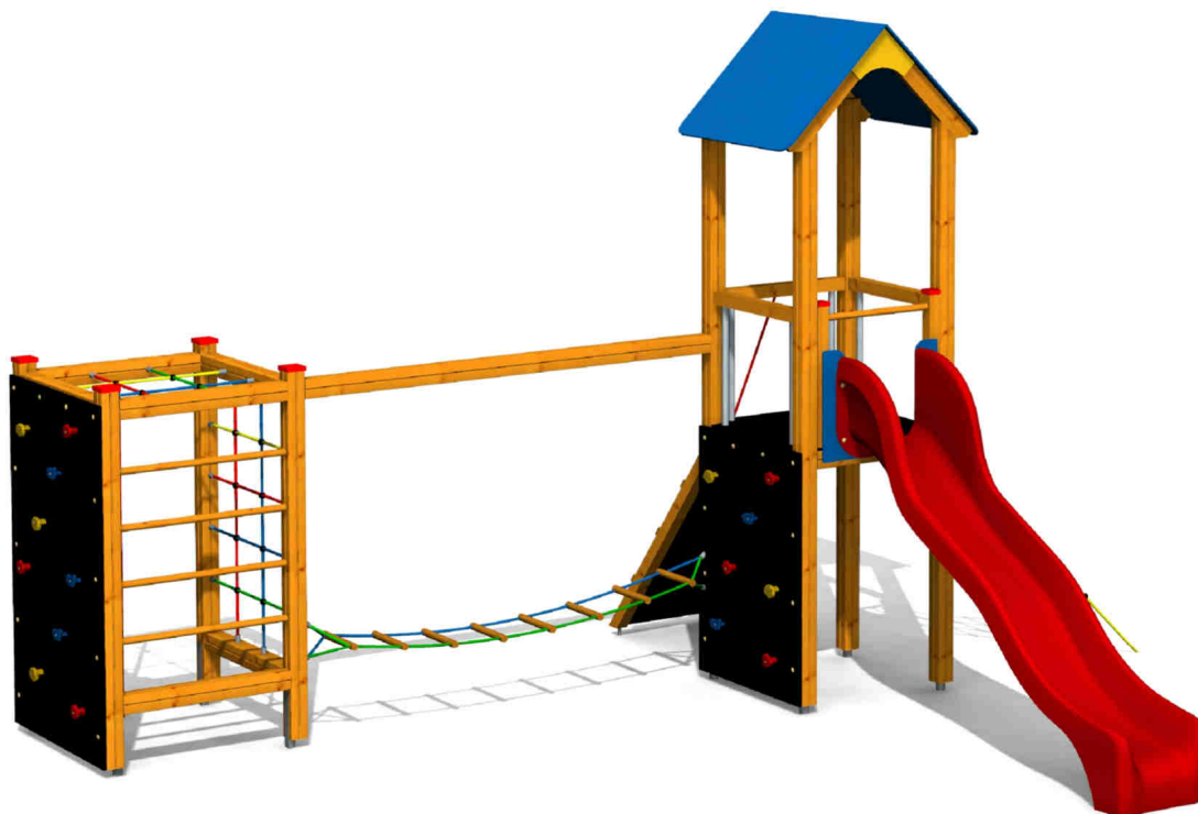
ilustrativní vyobrazení (provedení s lazurou)