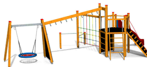
ilustrativní vyobrazení (provedení s lazou)

Dřevěná konstrukce je vyrobena z lepených, nebo mimostředových modřínových hranolů se zaoblenými hranami. Podesta, nástupní rampa a lezecké stěny jsou vyrobeny z voděodolné překližky s protiskluzovou úpravou. Skluzavka je vyrobena ze sklolaminátu, který vykazuje značnou odolnost proti nárazům, povětrnostním vlivům a UV záření. Plastové prvky jsou vyrobeny z polyetylenu Playtec, který zaručuje UV odolnost, barevnou stálost a velmi dlouhou životnost. Lanové části jsou sestaveny z lan s vícepramenným ocelovým jádrem. Zařízení je certifikováno a splňuje veškerá kritéria stanovená platnými normami a předpisy EU a ČR (ČSN EN 1176).