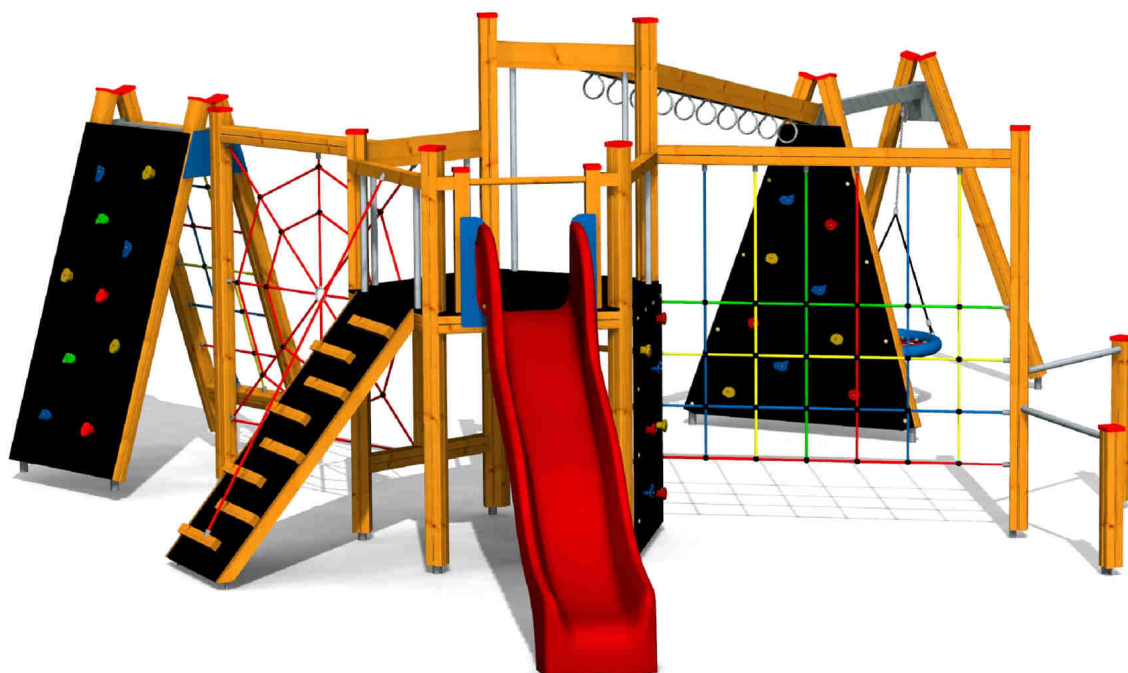
ilustrativní vyobrazení (provedení s lazurou)