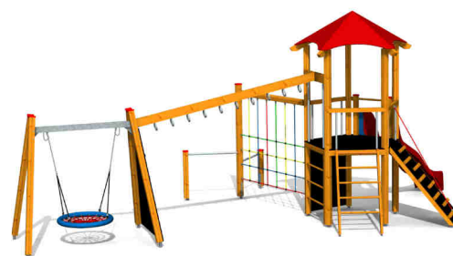
ilustrativní vyobrazení (provedení s lazurou)

Dřevěná konstrukce je vyrobena z lepených, nebo mimostředových modřinových hranolů se zaoblenými hranami. Podesta, nástupní rampa a lezecké stěny jsou vyrobeny z voděodolné překližky s protiskluzovou úpravou. Skluzavka je vyrobena ze sklolaminátu, který vykazuje značnou odolnost proti nárazům, povětrnostním vlivům a UV záření. Plastové prvky jsou vyrobeny z polyetylenu Playtec, který zaručuje UV odolnost, barevnou stálost a velmi dlouhou životnost. Lanové části jsou sestaveny z lan s vícepramenným ocelovým jádrem. Zařízení je certifikováno a splňuje veškerá kritéria stanovená platnými normami a předpisy EU a ČR (ČSN EN 1176).