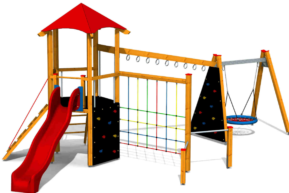
ilustrativní vyobrazení (provedení s lazurou)