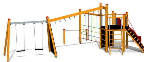
ilustrativní vyobrazení (provedení s lazurou)

Zařízení je certifikováno a splňuje veškerá kritéria stanovená platnými normami a předpisy EU a ČR (ČSN EN 1176).