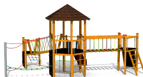
ilustrativní vyobrazení (provedení s lazurou)

Zařízení je certifikováno a splňuje veškerá kritéria stanovená platnými normami a předpisy EU a ČR (ČSN EN 1176).