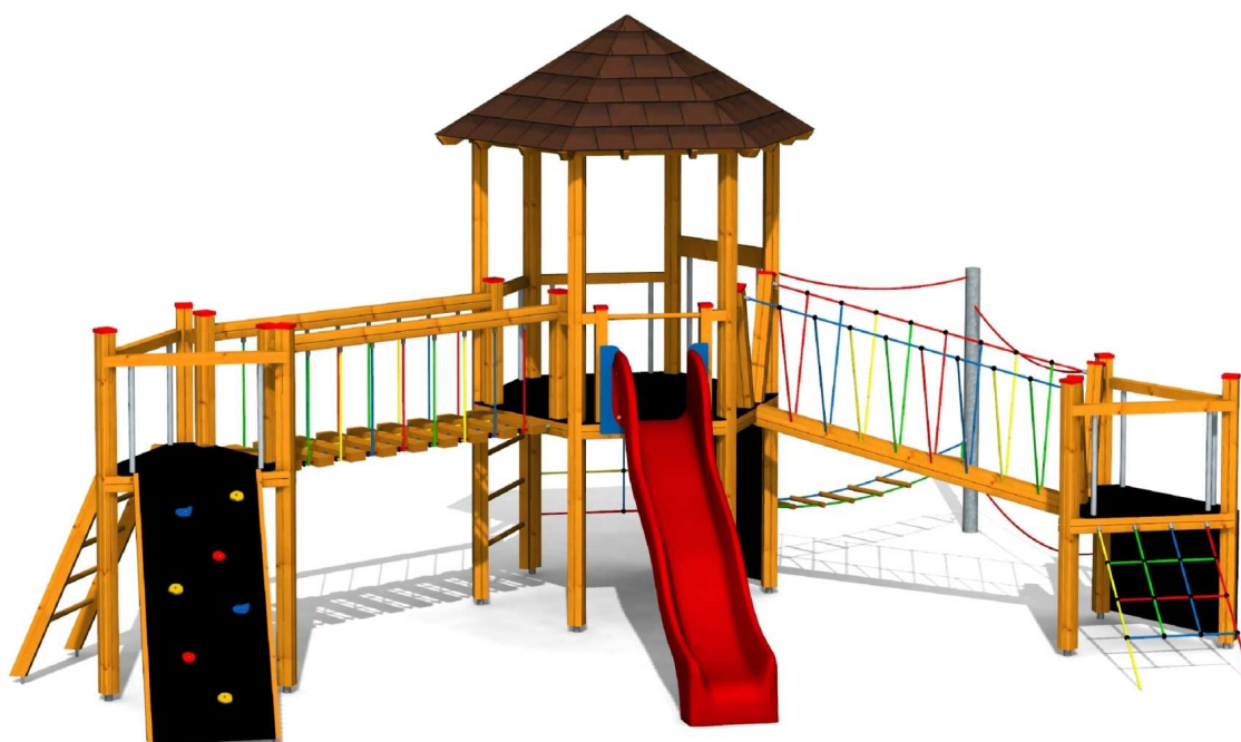
ilustrativní vyobrazení (provedení s lazurou)