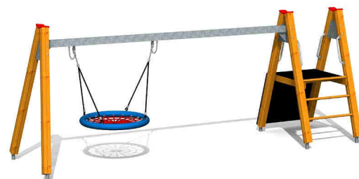
Ilustrativní foto (provedení s lazurou)

Zařízení je certifikováno a splňuje veškerá kritéria stanovená platnými normami a předpisy EU a ČR (ČSN EN 1176).