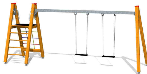
Ilustrativní foto (provedení s lazurou)

Dřevěná konstrukce je vyrobena z lepených, nebo mimostředových modřínových hranolů se zaoblenými hranami. Podesta je vyrobena z voděodolné překližky s protiskluzovou úpravou. Lanové části jsou sestaveny z lan s vícepramenným ocelovým jádrem. Ocelový nosník a kotvení jsou žárově zinkovány. Zařízení je certifikováno a splňuje veškerá kritéria stanovená platnými normami a předpisy EU a ČR (ČSN EN 1176).