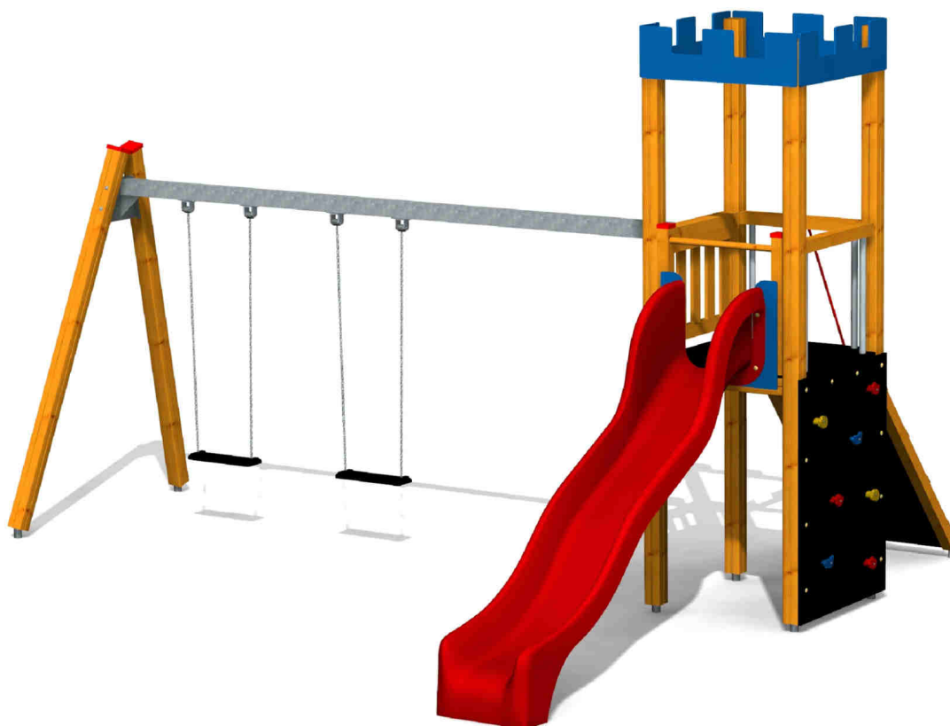
ilustrativní vyobrazení (provedení s lazurou)