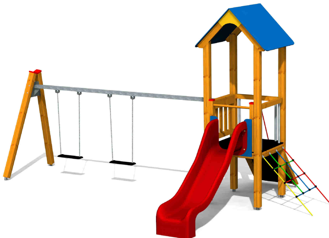
ilustrativní vyobrazení (provedení s lazurou)