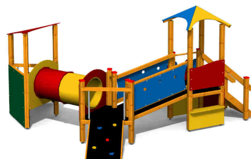
ilustrativní vyobrazení (provedení s lazurou)

Dřevěná konstrukce je vyrobena z lepených, nebo mimostředových modřinových hranolů se zaoblenými hranami. Nástupní rampa, lezecká stěna a podesty jsou vyrobeny z voděodolné překližky s protiskluzovou úpravou. Skluzavka je vyrobena ze sklolaminátu, který vykazuje značnou odolnost proti nárazům, povětrnostním vlivům a UV záření. Plastové prvky jsou vyrobeny z polyetylenu Playtec, který zaručuje UV odolnost, barevnou stálost a velmi dlouhou životnost. Lanové části jsou sestaveny z lan s vícepramenným ocelovým jádrem. Zařízení je certifikováno a splňuje veškerá kritéria stanovená platnými normami a předpisy EU a ČR (ČSN EN 1176).