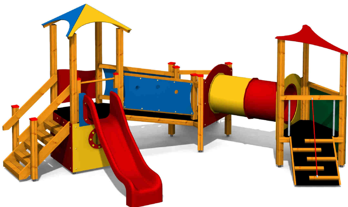
ilustrativní vyobrazení (provedení s lazurou)