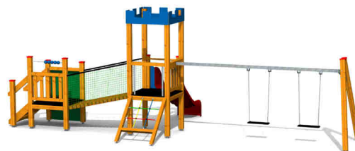
ilustrativní vyobrazení (provedení s lazurou)

Dřevěná konstrukce je vyrobena z lepených, nebo mimostředových modřínových hranolů se zaoblenými hranami. Ostatní dřevěné části jsou vyrobeny z modřínového masivu. Podesty jsou vyrobeny z voděodolné překližky s protiskluzovou úpravou. Skluzavka je vyrobena ze sklolaminátu, který vykazuje značnou odolnost proti nárazům, povětrnostním vlivům a UV záření. Plastové prvky jsou vyrobeny z polyetylenu Playtec, který zaručuje UV odolnost, barevnou stálost a velmi dlouhou životnost. Tabule na kreslení je vyrobena z vysokotlakého laminátu. Boční sítě jsou vyrobeny z polypropylenu. Ostatní Lanové části jsou sestaveny z lan s vícepramenným ocelovým jádrem. Koule počítadla jsou vyrobeny z modřínového lepeného dřeva. Tyčka počítadla je z nerezové oceli. Zařízení je certifikováno a splňuje veškerá kritéria stanovená platnými normami a předpisy EU a ČR (ČSN EN 1176).