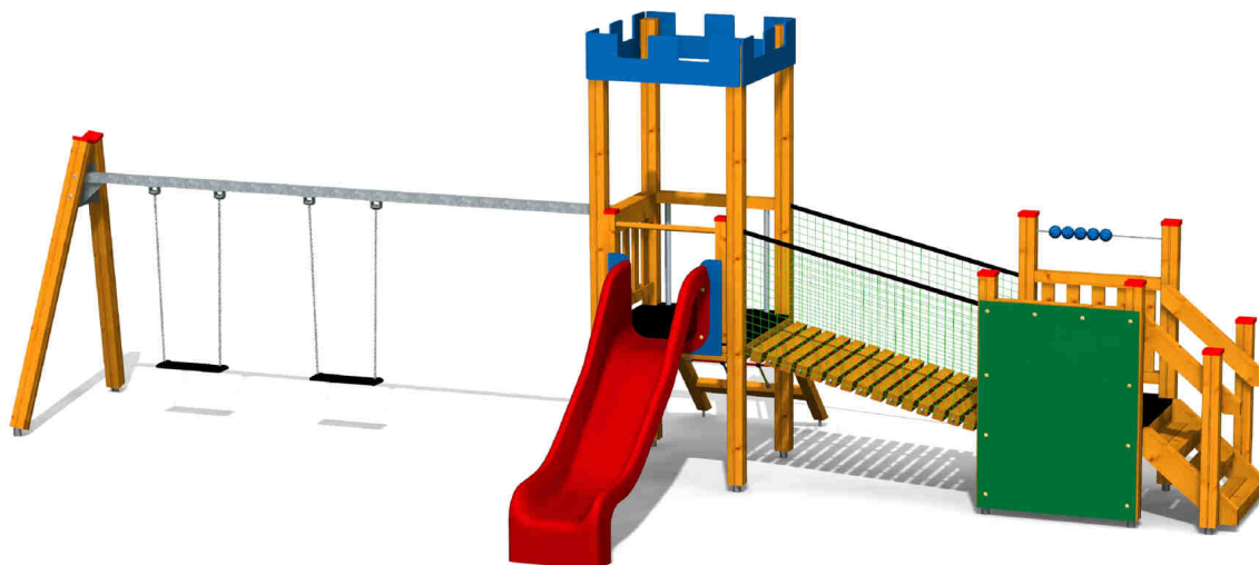
ilustrativní vyobrazení (provedení s lazurou)