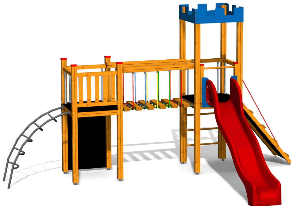
ilustrativní vyobrazení (provedení s lazurou)