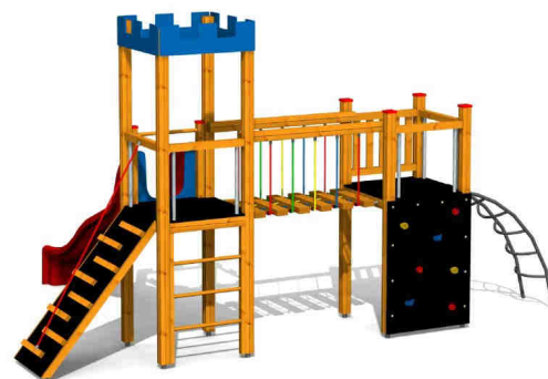
ilustrativní vyobrazení (provedení s lazurou)

Zařízení je certifikováno a splňuje veškerá kritéria stanovená platnými normami a předpisy EU a ČR (ČSN EN 1176).