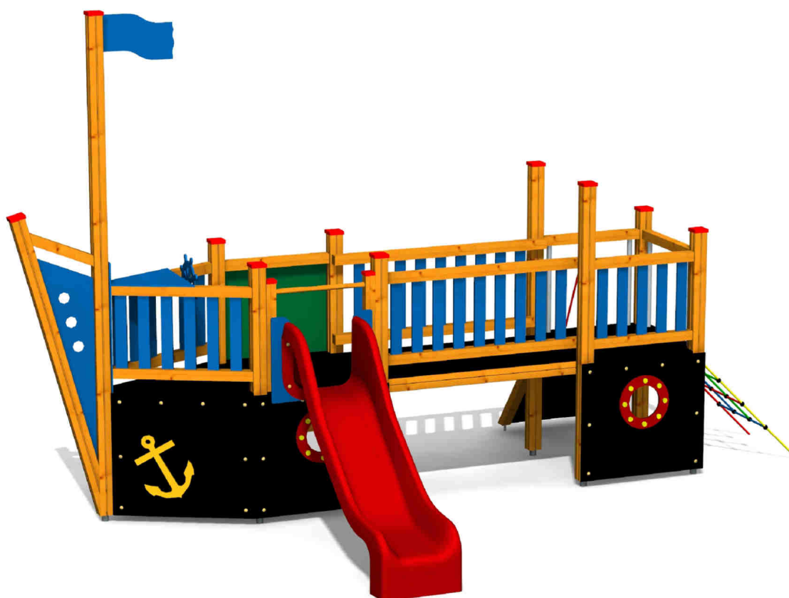
ilustrativní vyobrazení (provedení s lazurou)