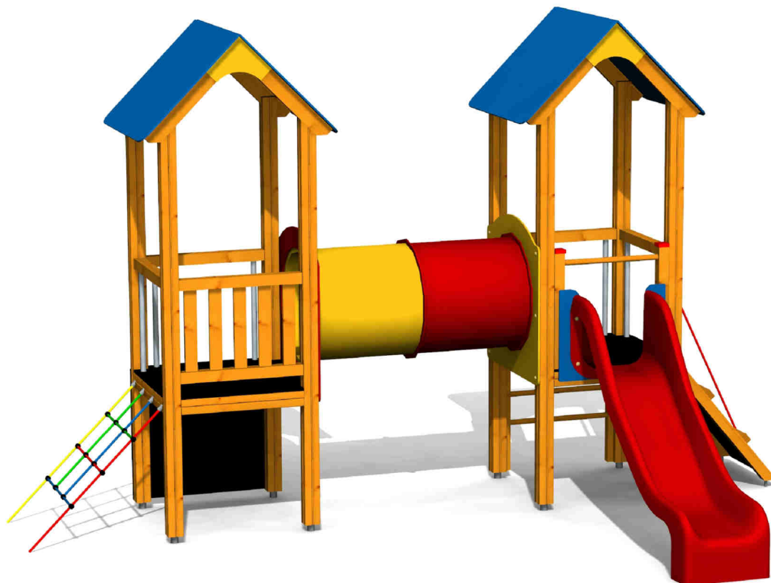
ilustrativní vyobrazení (provedení s lazurou)