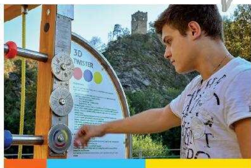
Výrobek je chráněn užitným vzorem